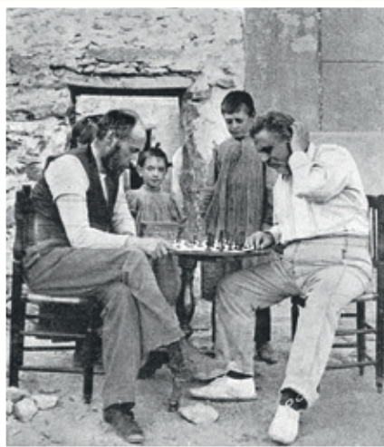
Ramón y Cajal, y su amigo Olóriz, fotografiados por un hijo del primero, durante una disputada partida de ajedrez en el patio de su casa de veraneo en Miraflores de la Sierra.

Precisamente aquí le sorprendería la funesta noticia del desastre de Cuba y Filipinas. De la estancia en nuestro pueblo, perturbada por aquella trágica circunstancia histórica, dejó testimonio en su autobiografía “Recuerdos de una vida”.