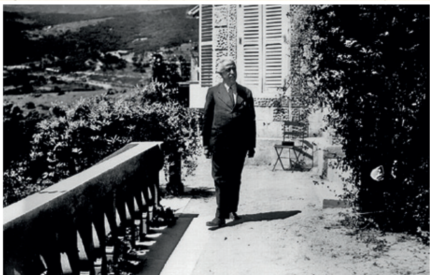
Niceto Alcalá-Zamora en 1931, paseando por la terraza de su residencia de verano en Miraflores de la Sierra.

Niceto Alcalá-Zamora (1877-1949), primera autoridad del Estado desde 1931 a 1936. Católico practicante, otra foto de la época le muestra saliendo de misa en nuestra iglesia de la Asunción.