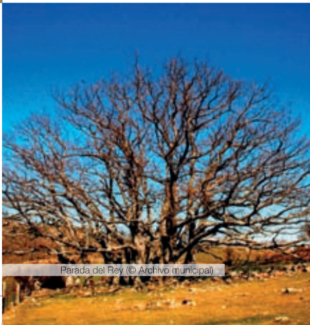
Parada del Rey