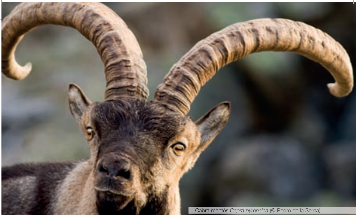
Cabra montés Capra pyrenaica