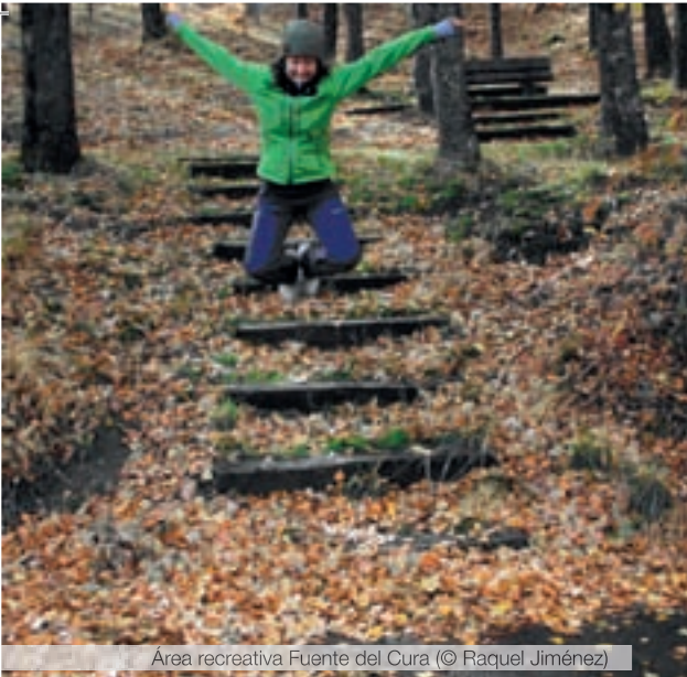
Área recreativa Fuente del Cura