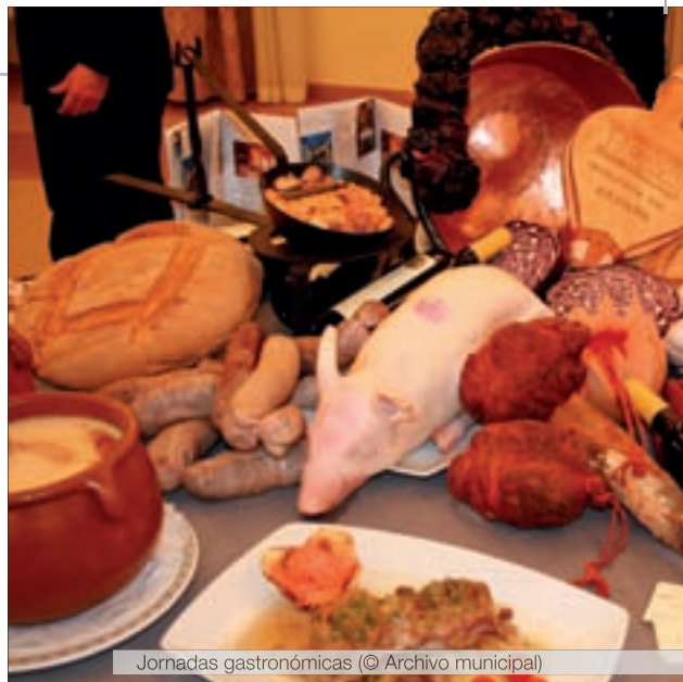
Jornadas gastronómicas

Bierfest Miraflores: Feria de la cerveza y de las tapas, que se celebra el primer fin de semana de julio. Se pueden degustar al menos 15 tipos de cerveza diferente y un amplio surtido de tapas de diseño preparadas especialmente para la ocasión por los restaurantes y bares de Miraflores.