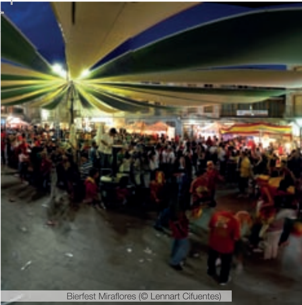
Bierfest Miraflores

A la par se celebra Expomiraflores : feria comercial que pretende dar a conocer los productos y servicios que nuestro pueblo ofrece, con el atractivo de celebrar una Pasarela de moda.