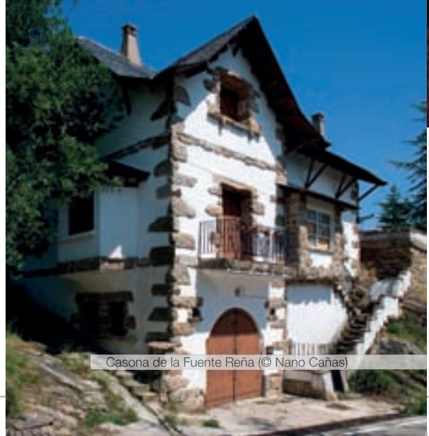
Casona de la Fuente Reña