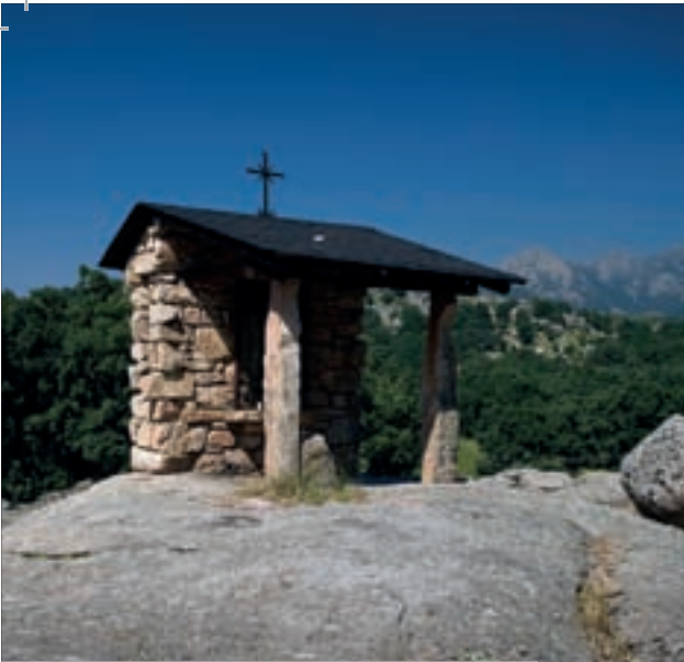
Humilladero de San Blas