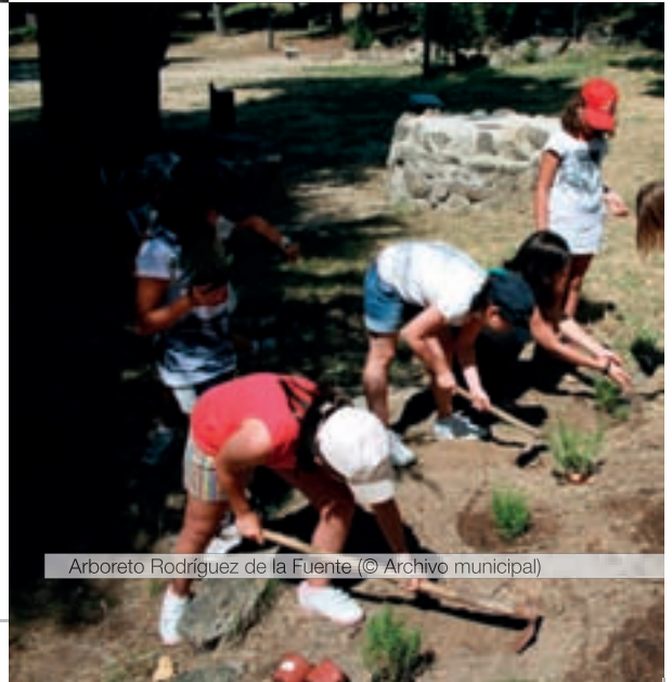
Arboreto Rodríguez de la Fuente

El Arboreto, tiene un enfoque didáctico que lo convierte en un excelente instrumento para la educación medioambiental durante las cuatro estaciones del año y es punto de arranque del Sendero Local 01, que asciende al Pico de la Pala.