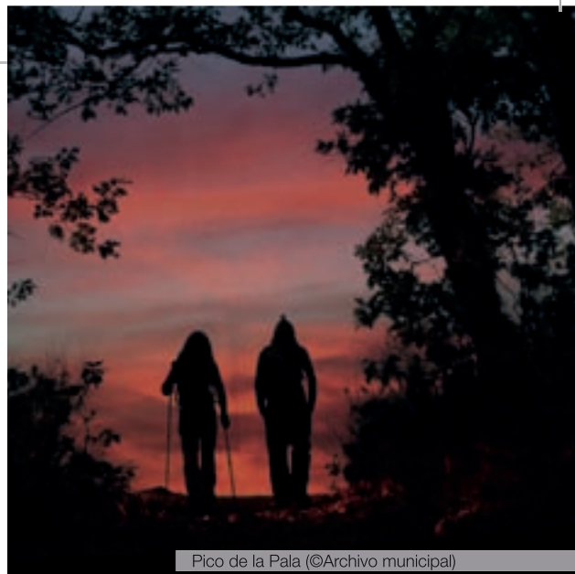
Pico de la Pala

Miraflores de la Sierra cuenta con un entorno natural privilegiado, al ser un punto estratégico entre los puertos de Canencia y Morcuera. Y por ello, es un inmejorable destino para senderistas, ciclistas, aficionados al turismo activo o al motor.