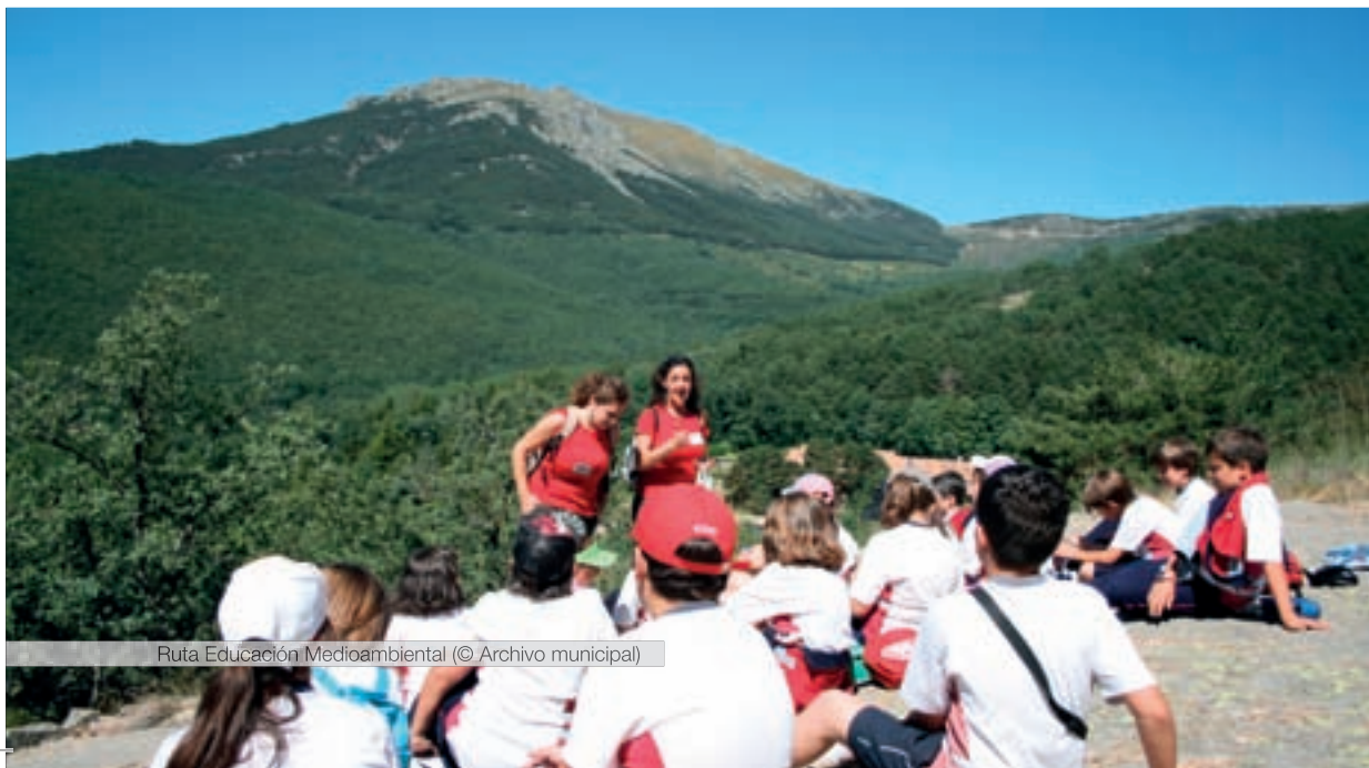
Ruta Educación Medioambiental

Entre otras actividades, destacan Rutas a Caballo, Coto deportivo de pesca, Parapente (Bautismo de vuelo, Safari aéreo...), Paintball, Segway, Club Senderista y Club Ciclista.