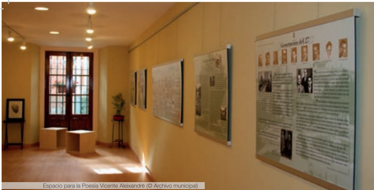
Espacio para la Poesía Vicente Aleixandre