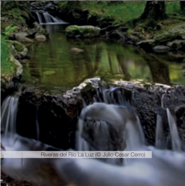
Riberas del Río La Luz

Para más información consulta la guía de rutas turísticas de Miraflores de la Sierra