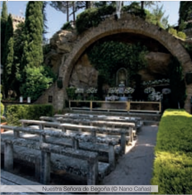
Nuestra Señora de Begoña