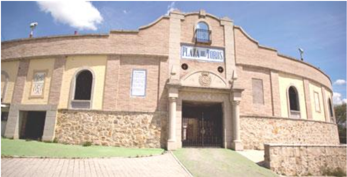
Imagen 2. Fotografía del edificio.